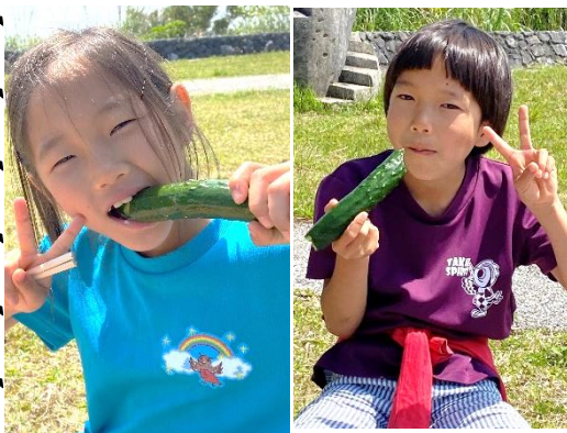
↑大好物のハイ！きゅうり！