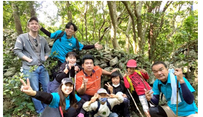
↑400年前からある石垣の前で記念撮影！