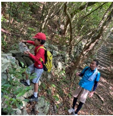
↑石垣へ石を積み上げ