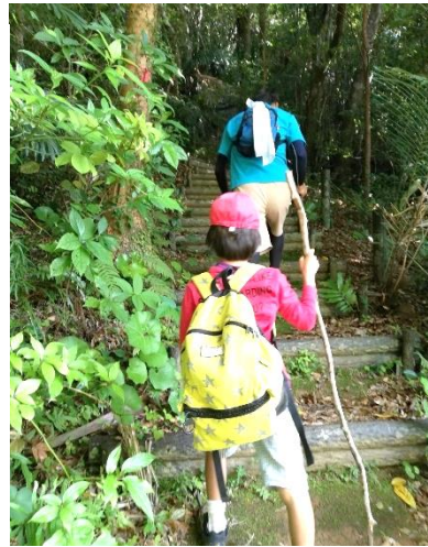
↑木の杖で元気に歩きます

2時間ほどの山道を色々な植物やトカゲなどに触れあいながら楽しく元気いっぱい歩き子どもたちでした。