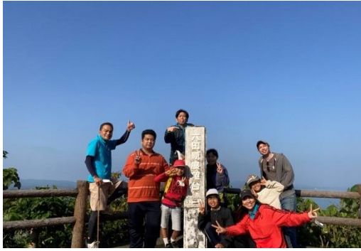
↑快晴！ハイキング日和！