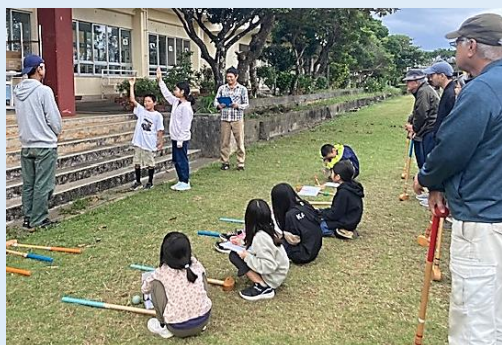
児童による選手宣誓(開会式)

会員同士の親睦を図り、連携を深める事で、より一層の学校教育向上に資する事等を目的として計画されています。運営してくれた保体部の皆さんありがとうございました。