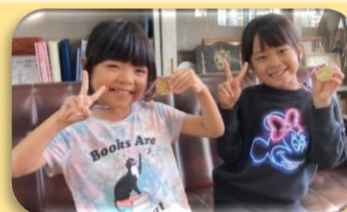
11/25 かけ算九九チャレンジ合格