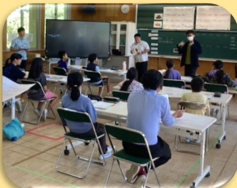
11/20 5年生集合学習 村外国語研修会・研究授業(弘樹先生)