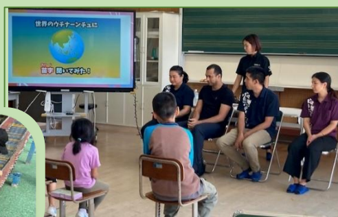
↑ 11/14 海外子弟研修生との交流会

東村にルーツのあるブラジルからの研修生が来校し交流会を実施しました。海外で暮らすウチナンチュクイズや移民の歴史について学びました。