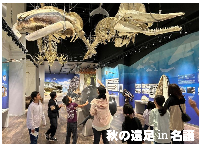
秋の遠足 in 名護

11月21日に秋の遠足がありました。名護博物館見学後、名護城公園ウーマク広場で過ごしました。児童は、お弁当作りにも携わりよい経験となりました。ご協力いただいた保護者の皆様ありがとうございました。