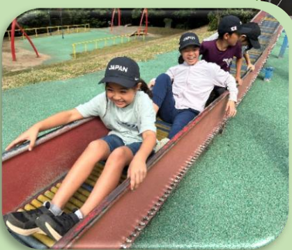
11/21 秋の遠足 30メートルのローラー滑り台