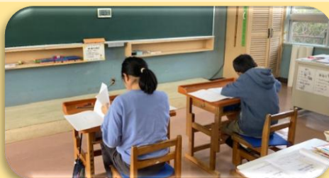
11/20 県学力到達度調査(56年)