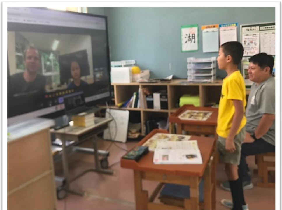
6年外国語 「好きなものの紹介」有銘小児童とオンライン交流 *6年生は村内小学校6年生と状況に合わせて柔軟にオンライン交流を実施。