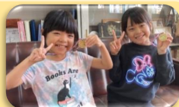
11/25 かけ算九九チャレンジ合格