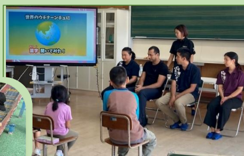
↑ 11/14 海外子弟研修生との交流会

東村にルーツのあるブラジルからの研修生が来校し交流会を実施しました。海外で暮らすウチナンチュクイズや移民の歴史について学びました。