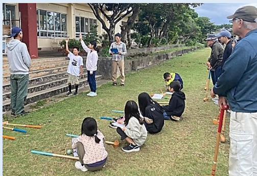
児童による選手宣誓(開会式)

会員同士の親睦を図り、連携を深める事で、より一層の学校教育向上に資する事等を目的として計画されています。運営してくれた保体部の皆さんありがとうございました。